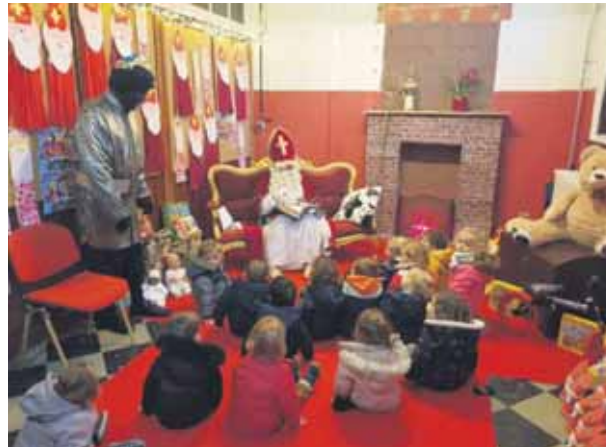
Venue de Saint-Nicolas pour les petits et les grands le vendredi 6 décembre.