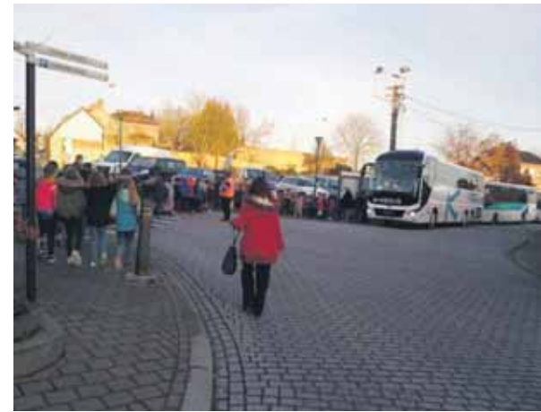
Le mardi 10 décembre, toute l'école s'est rendue au cinéma.