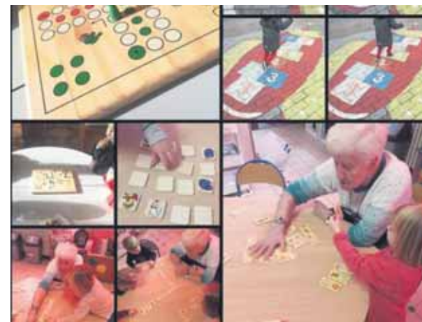
Les enfants d'accueil et première maternelle ont invité les grands parents à l'école les mercredis 13 et 27 novembre.