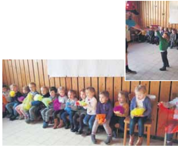
Animation donnée par l'ASBL «Crazy circus» pour les classes de 2ème et 3ème maternelle.