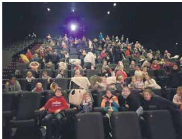
Les enfants d'accueil jusqu'à la 4ème primaire sont allés voir le dessin animé « L'abominable ». Un superbe moment passé tous ensemble !