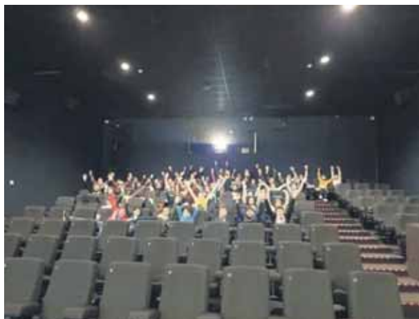
Les grands de 5ème et 6ème primaire sont allés voir le film « Maléfique ».