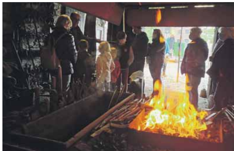
Des animations pour les petits... et les plus grands