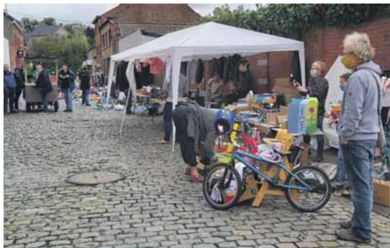
Une brocante, réduite, mais ambiancée !