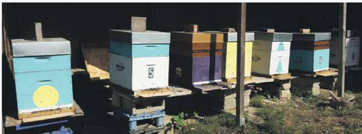
« Les ruches sont de couleurs différentes pour que les abeilles reconnaissent leur propre ruche »

Miel à vendre (8€/500gr) Shérif HAMDIS 067 6467 75 - 0496 78 50 20 Rue de Clabecq, 4 à 1460 ITTRE