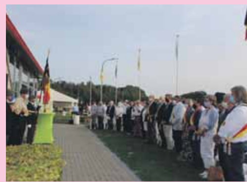
Les élus locaux, masqués, mais remplis de fierté !