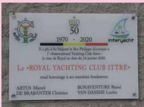
Plaque commémorative, officiellement accrochée à la façade d'Interyacht depuis le 11/09/2020.