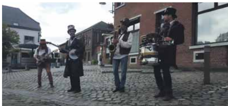
« Folk Dandies », un groupe endiablé